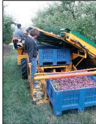
•Tartályláda kezelő platform.

Az NSTP betakarítógép innovatív tartályláda kezelő platformjának köszönhetően a gép leállítás nélkül tud dolgozni, így biztosítva a maximális termelékenységet